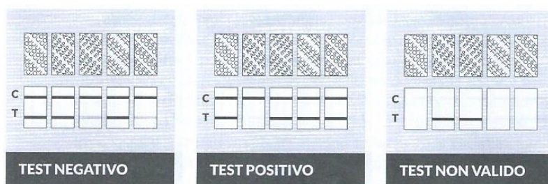
Assenza di sostanze stupefacenti

Le ragioni più plausibili per questa assenza di risultato sono da attribuirsi nella maggior parte dei casi ad un procedimento scorretto, oppure il test è fallato. In tal caso fare una foto alla card e contattateci.